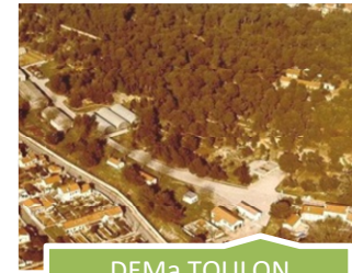
DEMa TOULON LES ARENES