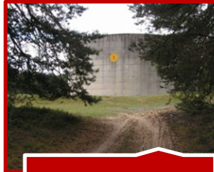
DEP LA FERTE ALAIS