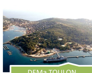
DEMa TOULON LE LAZARET