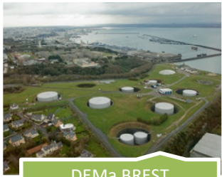
DEMa BREST MAISON BLANCHE